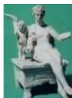
A.I.C.C. - Delegazione di Taranto