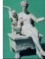
A.I.C.C. - Delegazione di Taranto