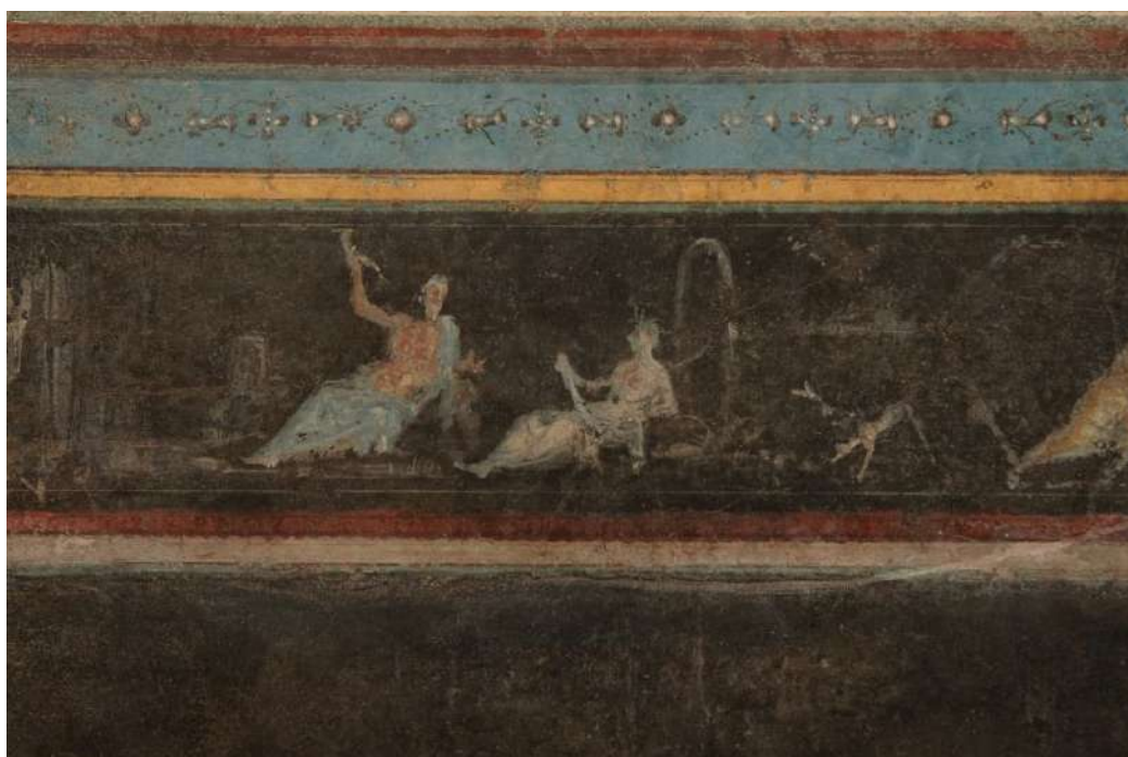
da Bragantini-Pirelli, Fregio della villa romana della Farnesina, particolare.

(emer. Università degli studi di Napoli, “L’Orientale”)