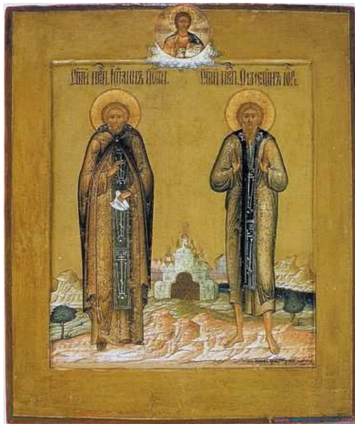
Santi Simeone Salos e Giovanni di Edessa Icona russa (XIX sec.)

di Isabella Gagliardi (Università di Firenze)