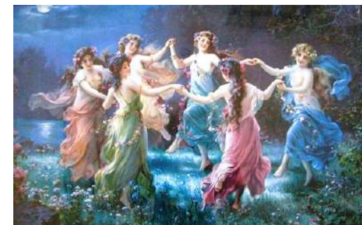
Le 7 Pleiades che ballano