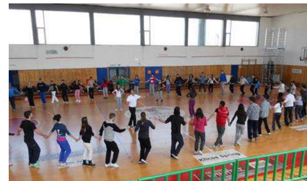
Lezione di danza con i suoi studenti all'Università della Tessaglia, a Trikala

Vivremo insieme un fine settimana indimenticabile.