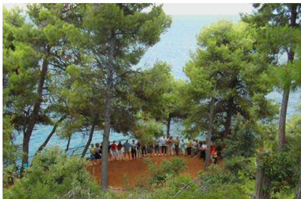
Danza nella natura (montagna e mare), l'estate al seminario di Pillion