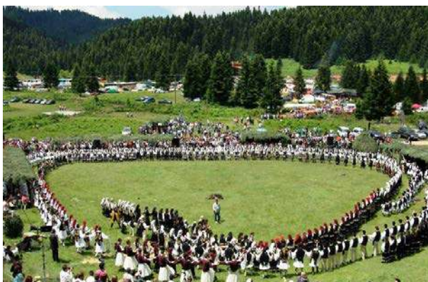
Come nell'antica Grecia, si svolge anche oggi "La danza del sole"

Tema: Viaggio di danza attraverso la Grecia