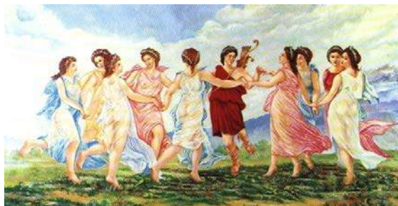
Le 9 Muse ballano con "Mousegetis= il maestro di musica" Apollo"

La vita è ritmo, il ritmo è il respiro, il respiro è movimento, il movimento è ritmo, il ritmo è danza, la danza è vita! G.Dimas