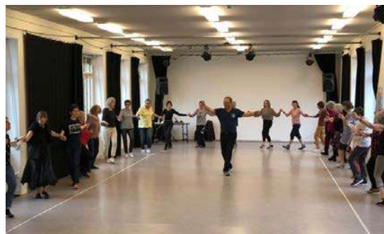
Il seminario che si è svolto a Locarno in novembre 2019

Alloggi consigliati: www.vecchia-locarno.ch in città vecchia; Hotel dell'Angelo , www.dellangelo.ch