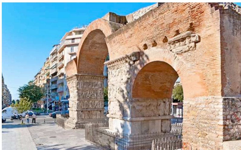
Arco di Galerio

Giornata dedicata alla visita a piedi di Salonicco , seconda città della Grecia per importanza artistica e finanziaria. In mattinata visita ai resti della città romana (Palazzo di Galerio, Arco di Galerio, Agorà romana). Nel pomeriggio visita al Museo Archeologico; a seconda del tempo a disposizione, visita al Museo Bizantino. Cena e pernottamento a Salonicco.