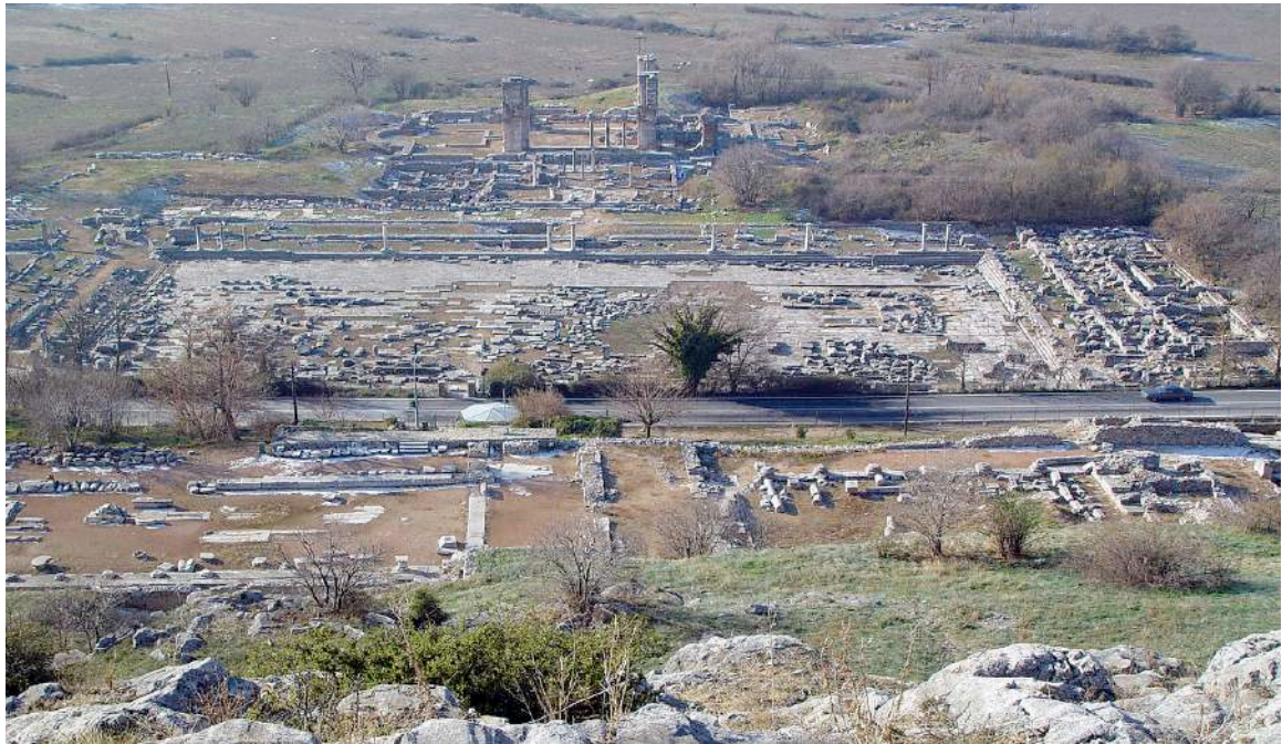
Area archeologica di Filippi