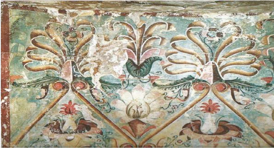
Dipinti della Tomba delle palmette

Trasferimento a Mieza , una delle principali città del regno macedone. Visita alle tombe dipinte di Lefkadia (Tomba delle Palmette e Tomba del Giudizio), tra le più famose della Macedonia.