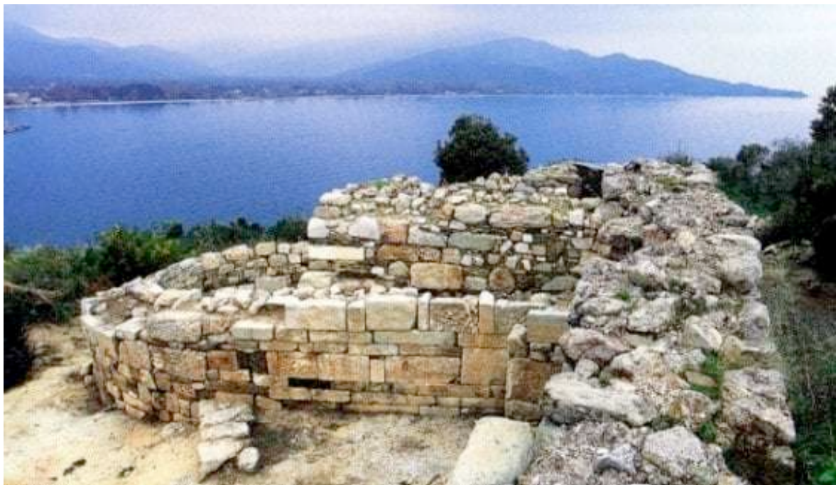
Area archeologica di Stagira (particolare)

Trasferimento, al mattino presto, a Stagira , città natale di Aristotele; visita dell'area archeologica che si affaccia sul mare con uno splendido scenario.