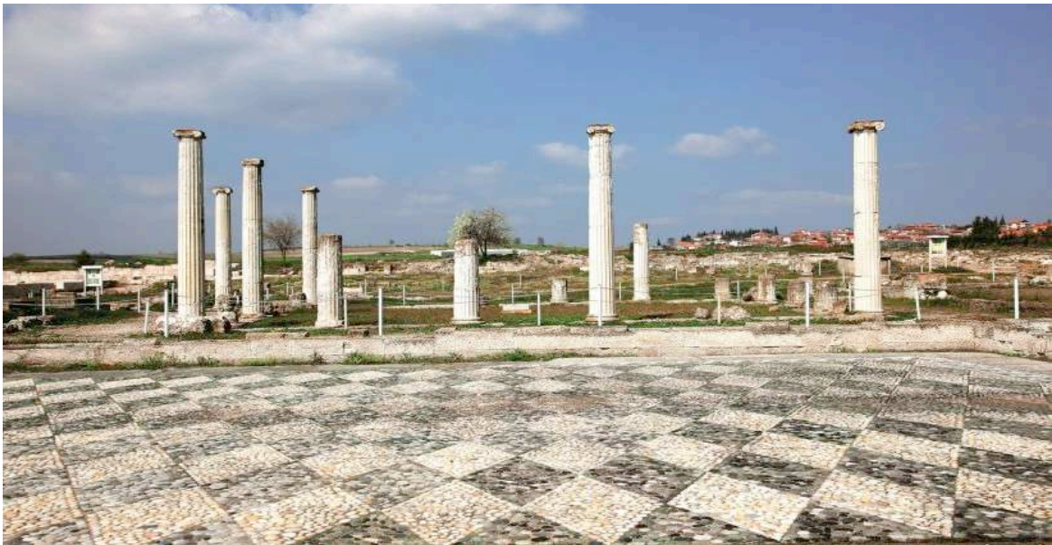
Foro di Pella

Proseguimento per Pella , una delle capitali antiche della Macedonia, città natale di Alessandro Magno. Dopo pranzo visita dell'area archeologica e del museo annesso.