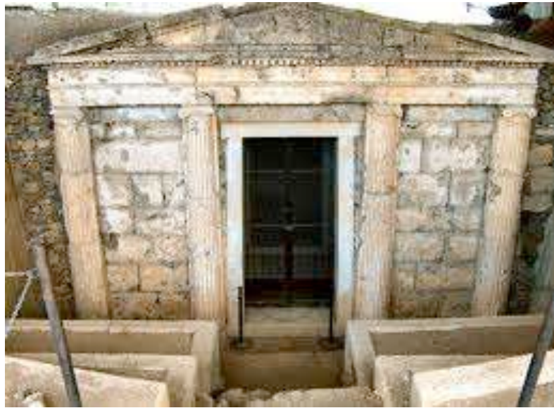
Tomba di Filippo II a Verghina

Rientro a Salonicco e visita della Rotonda di Aghios Georghios. Cena e pernottamento a Salonicco.