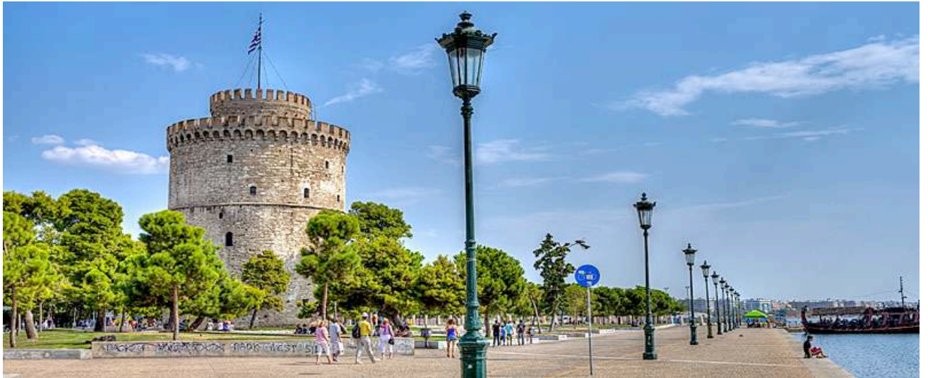
Salonicco - Rotonda di Aghios Georghios.

Partenza da Milano-Malpensa alle ore 11.00 (volo di linea Aegean Airlines), con scalo ad Atene e arrivo a Salonicco alle alle ore 16.10. Prima panoramica orientativa della città. Cena e pernottamento a Salonicco.