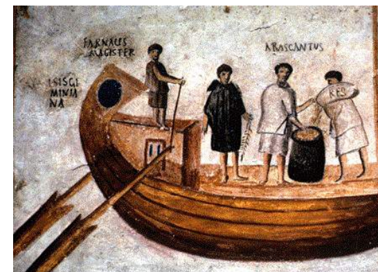
Marinai e commercianti da tutto il mondo sulla nave mercantile Isis Geminiana , da Ostia Antica

17.15 Consegna attestati di partecipazione