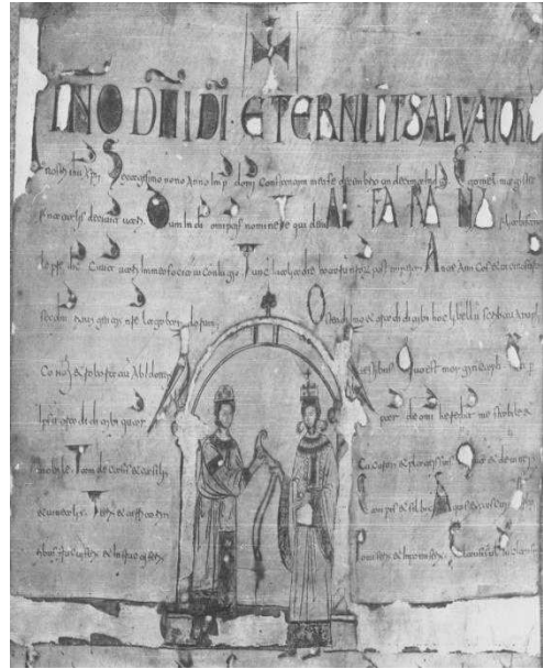
Morgengabe (1027) Archivio del Capitolo Metropolitano di Bari piazza Bisanzio e Rainaldo, n. 12