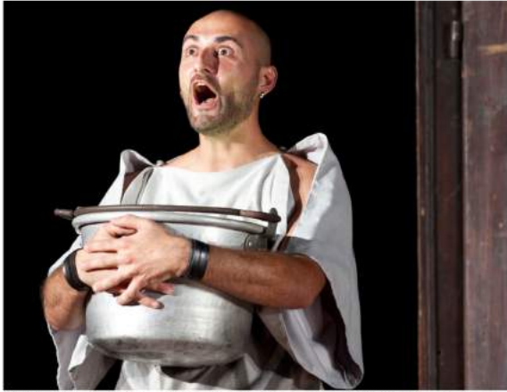
AULULARIA - Plauto nelle scuole 2014 - 2015

Ecco alcuni estratti delle recensioni degli studenti che hanno aderito al progetto lo scorso A.S.