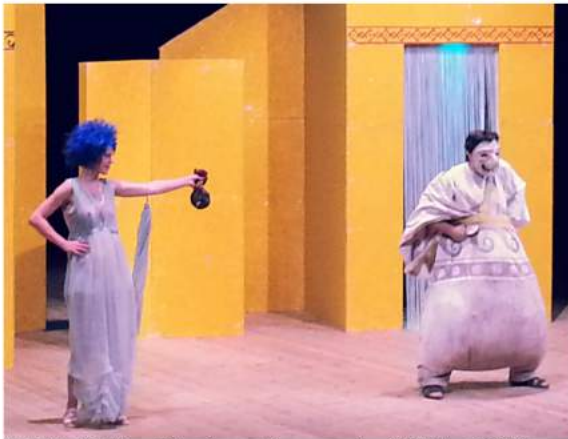
MENECEMI - Plauto nelle scuole 2015 - 2016

"L'abilità di questa compagnia teatrale si è espressa non solo nella capacità di riadattare il testo, ma anche nella spazialità scenografica che ha reso ancora più realistica la vicenda: l'idea originale di allestire un palcoscenico all'interno del palcoscenico è una novità, che colpisce."